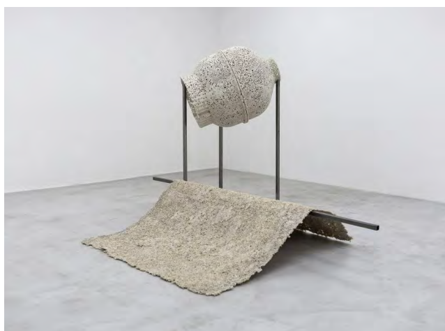
O3 VALENTIN MARTRE, 2020